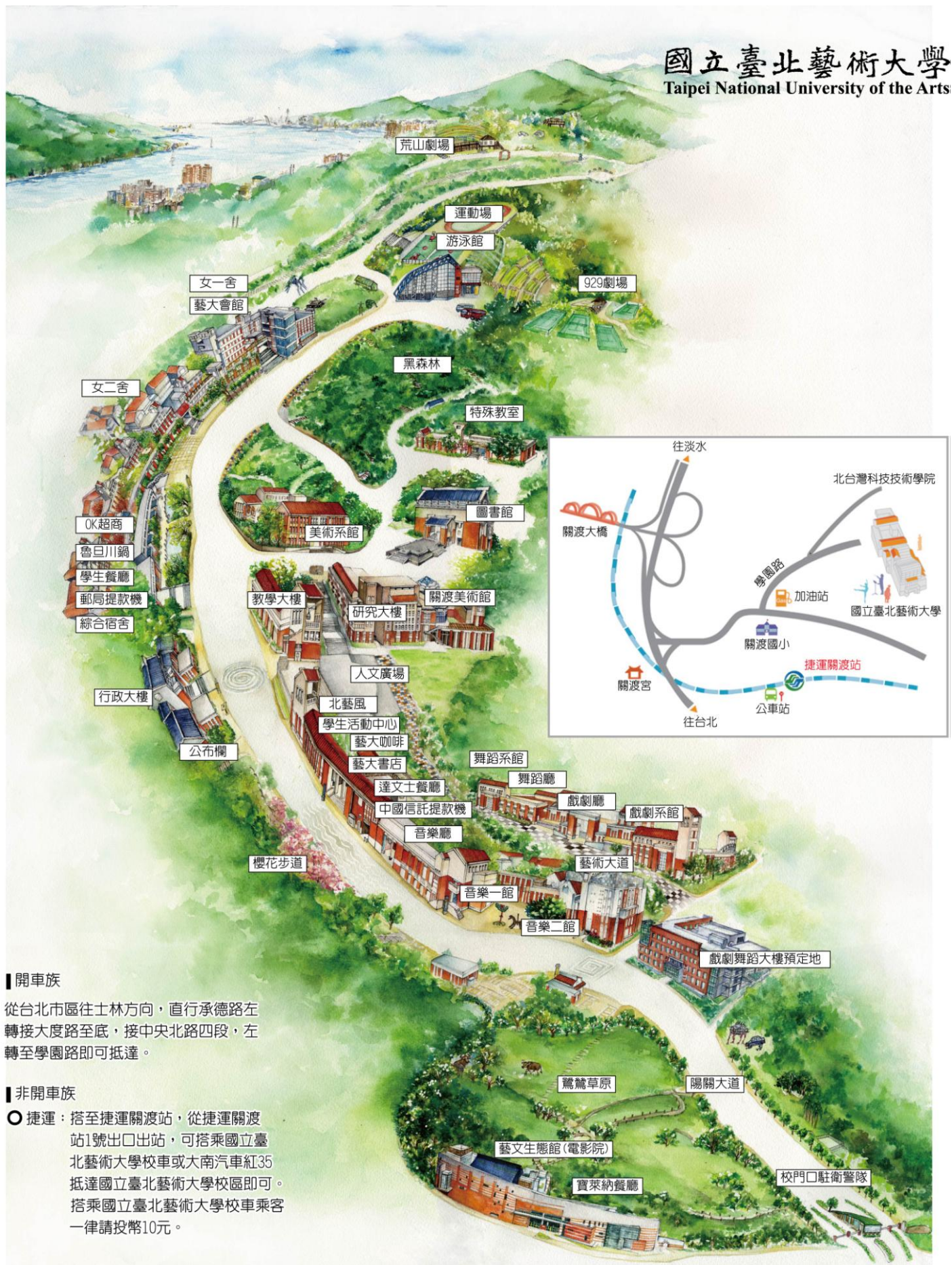
附圖一 本校交通情況及平面圖

國立臺北藝術大學 Taipei National University of the Arts